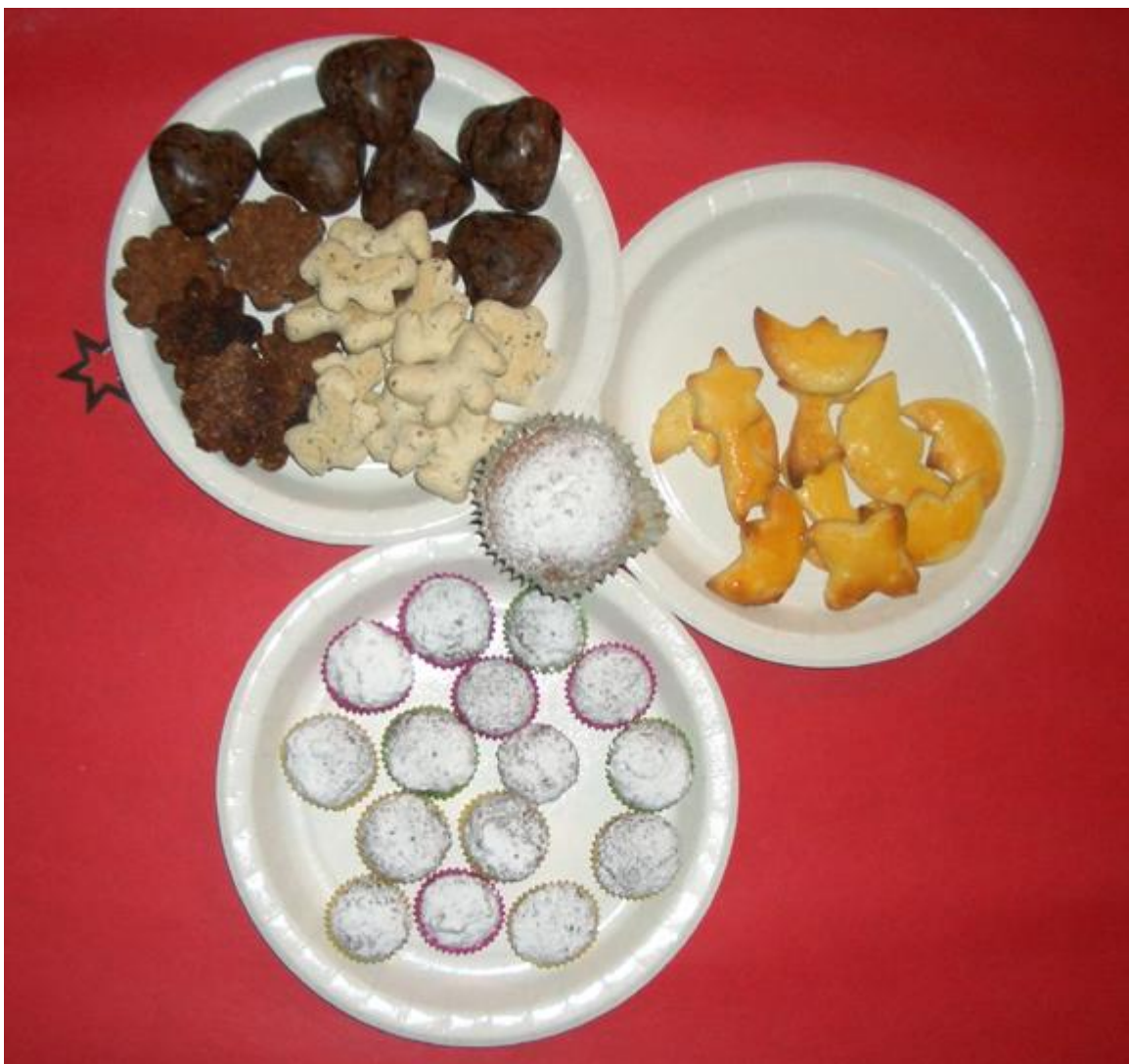
Kreativ und fleissige FDP-Frauen