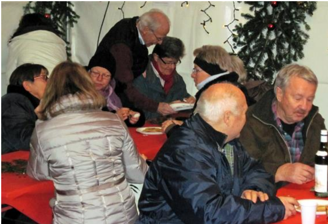
Gemütliches Beisammensein, friedliches Reden mit Bekannten und weniger Bekannten