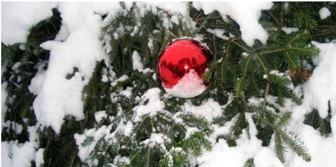
...was es braucht, um Weihnachts-Stimmung hinzuzaubern!