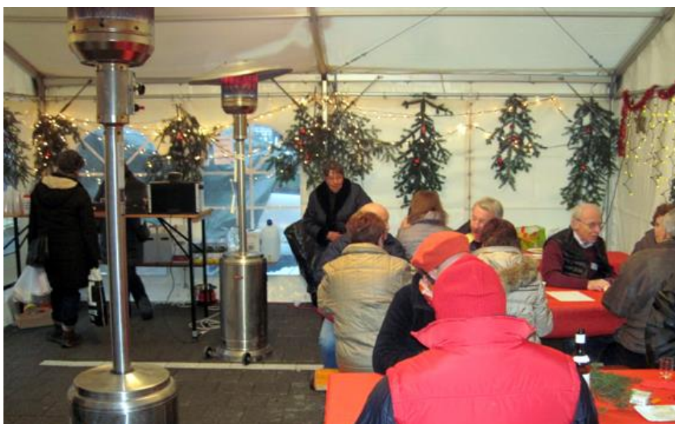
Gemütlich hergerichtertes Zelt mit Heizung