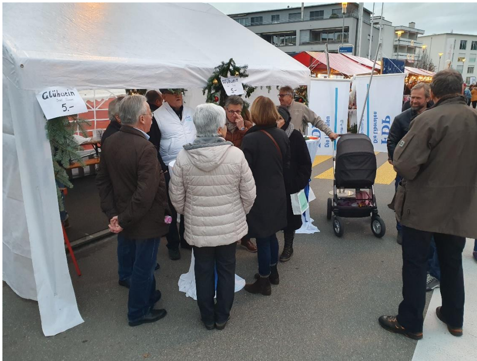
Die Gäste kommen, incl. auch der FDP-Nachwuchs wird angerollt ....