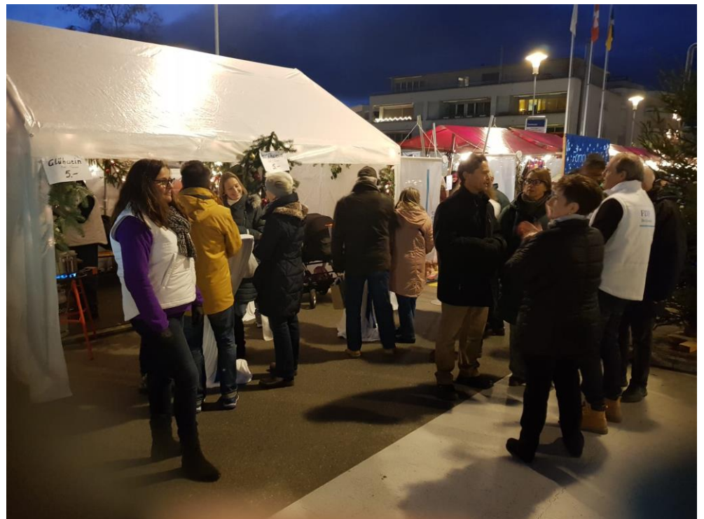
Der Abend ist angebrochen, ein wenig romantische? festliche? Stimmung kommt hoch .....