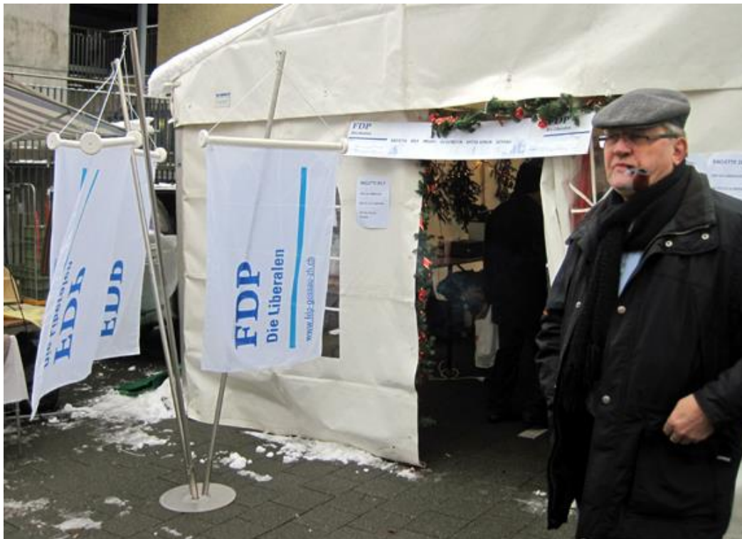
"Tursteher" als Geniesser mit Pfeife, heute ein Bild mit Seltenheitswert