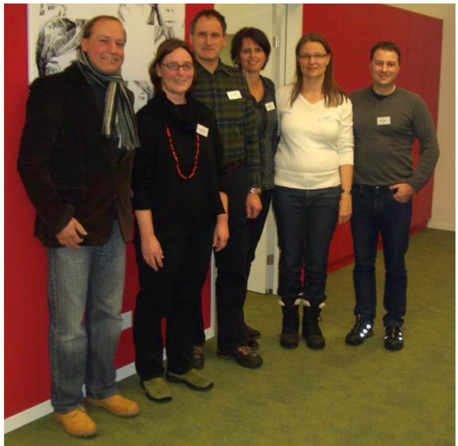
Alle freuen sich über die neuen, praktisch eingerichteten Räumlichkeiten im Schulsekretariat