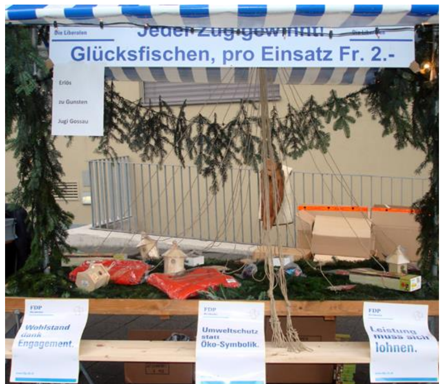
Alles bereit zum Fischen....