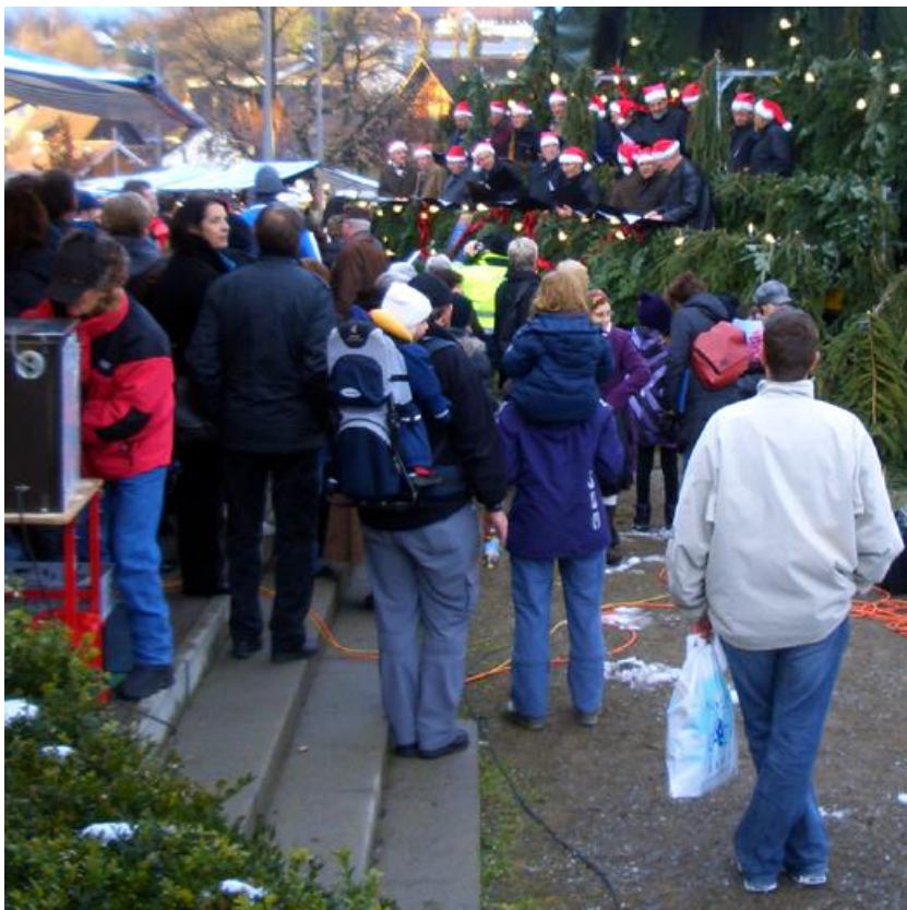
Der Männerchor Gossau ZH bringt sich in Position vor einer beachtlichen Zuschauerkulisse.