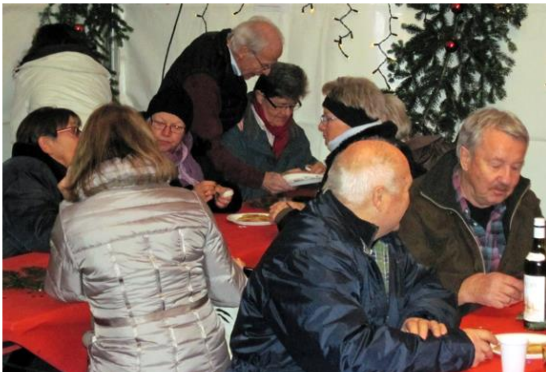
Gemutliches Beisammensein, friedliches Reden mit Bekannten und weniger Bekannten