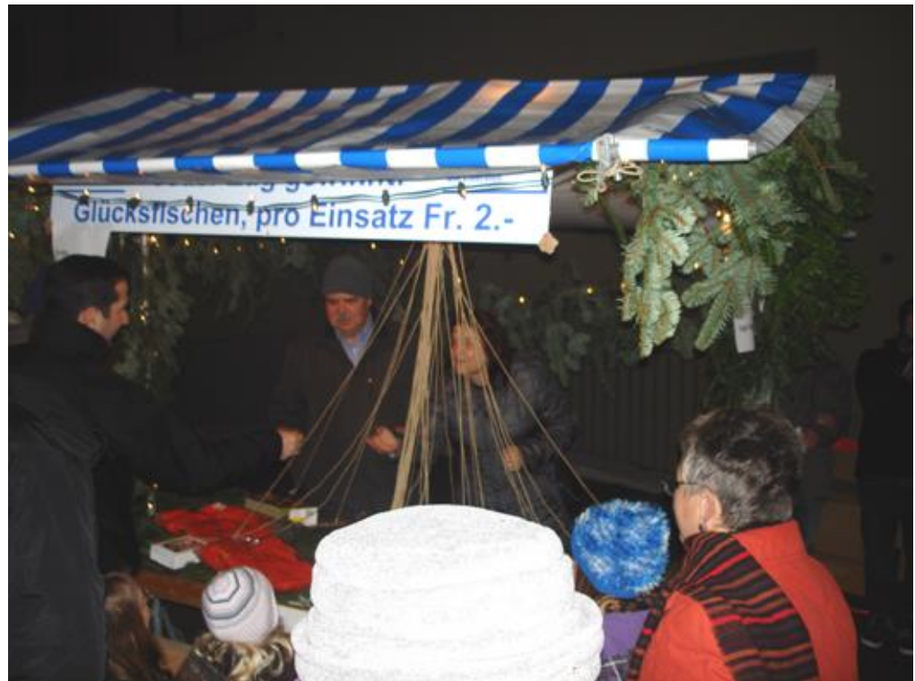
Das Ehepaar Biber hat alle Hände voll zu tun, kann den Andrang kaum bewältigen...