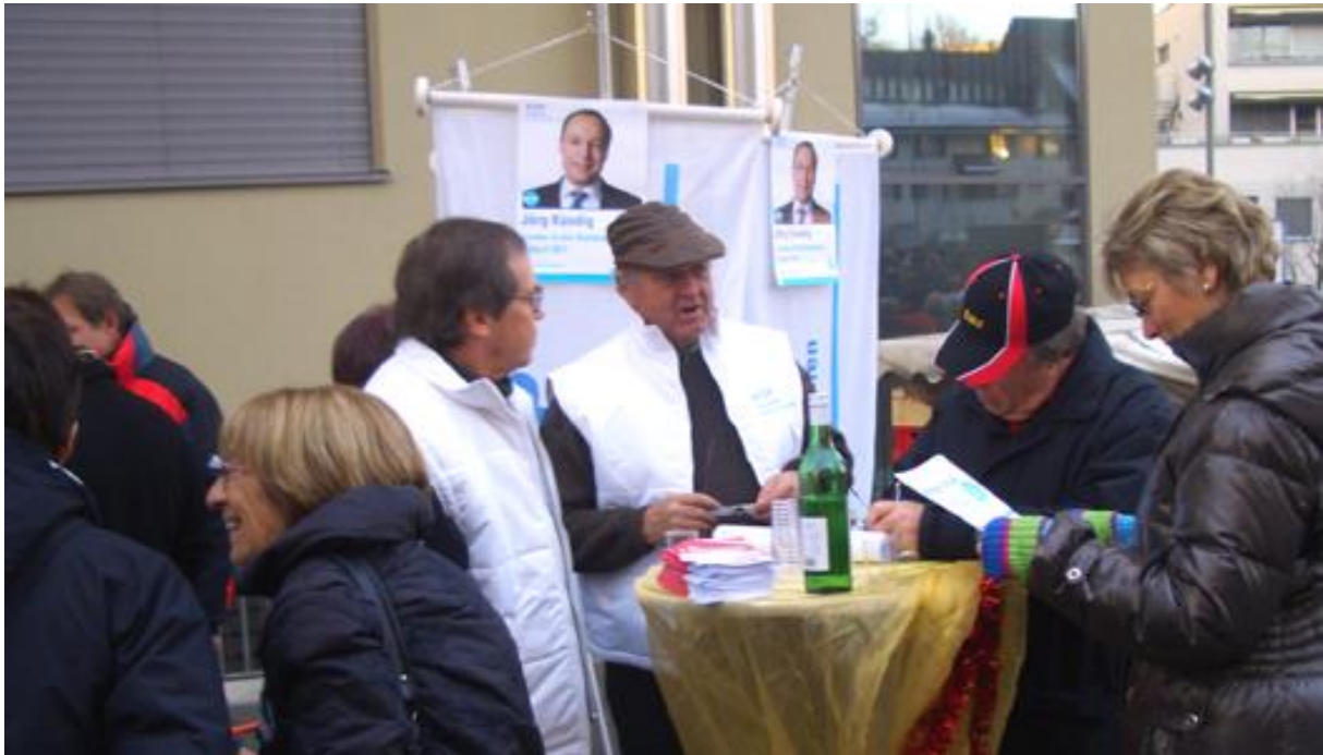
Von A-Z herrscht reger Betrieb durch das Lesen, Überzeugen, Unterschreiben...