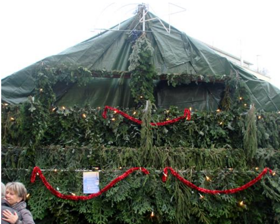
Erstmals am Gossauer Wienachtsmärt eine eindrückliche "Bühne" aus Tannenzweigen und Lichterglanz für die verschiedenen Gesangsformationen. Auch geeignet als Hintergrund um sich herzlich zu begrüßen.